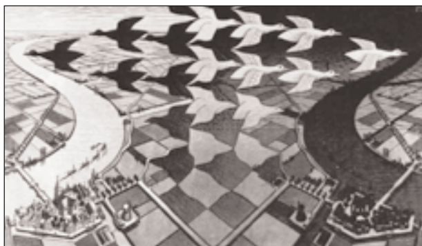
2. ábra – M. C. Escher: Nappalok és éjszakák

korlátok mibenléte, keménysége hirtelen másként látszik. Az ok-okozati láncok másképpen rajzolódnak ki, mint korábban. Bármennyire kívánatos és – a neoklasszikus tudományfelfogás szerint – „illendő” lenne is, a tények és az ok-okozati elemzés épp a legfontosabb közgazdasági kérdésekben nem választható el mereven egymástól. Érveinek alátámasztására Kornai M. C. Escher holland művész egyik híres, a pszichológiai szakirodalomban gyakran idézett képére utal. Első ránézésre a képen fekete madarak repülnek jobbról balra. De ha jobban megnézzük, úgy is láthatjuk, hogy nem fekete, hanem fehér madarak repülnek, méghozzá balról jobb felé (2. ábra).