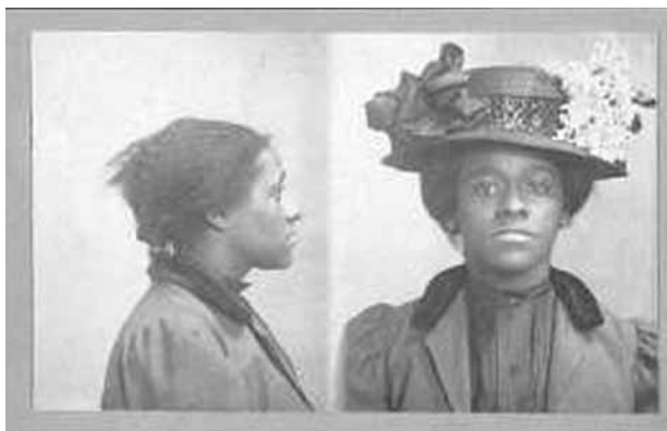
Bertillon-féle rendőrségi fotó, 1910

Ez a felfogás azonban megkérdőjelezhető, mert túl szűken vonja meg az elemzett jelenség kontúrjait. Egyrészt az általánosítás és általában a profilalkotás indoka nagyon is racionális lehet: erőforrásainkat a lehető leghatékonyabban kívánjuk felhasználni. Ez a szándék egyáltalán nem bűnös. Így az a következtetés, hogy egyes etnikai csoportok tagjai nagyobb valószínűséggel kerülnek kapcsolatba jogellenes cselekedetekkel, és ezért bizonyos esetekben szorosabb