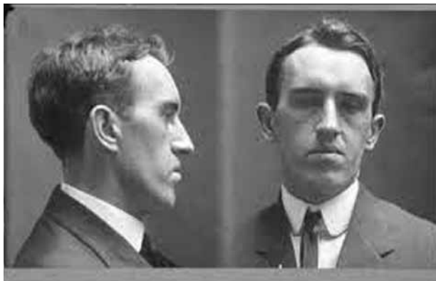
Bertillon-féle rendőrségi fotó, 1911

módja, gyenge alapnak tűnik bármiféle rendőri cselekvéshez. Ilyenkor az etnikai profilalkotást az etnikai jegyek figyelembevételként definiálják – szembeállítva azokkal az esetekkel, amelyekben a bűncselekmény „megbízható információ” vagy „objektív információ” alapján kapcsolható egy bizonyos etnikai csoporthoz. 8 A szembeállítás ugyanis azt sugallja, hogy az így definiált gyakorlat eleve nem lehet igazán objektív és megbízható.