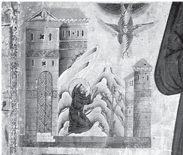
1. Bonaventura Berlinghieri: Szent Ferenc csodái (részlet). Pescia, San Francesco, 1235.

A testiség megnyilvánulásainak és megítélésének történeti és pszichológiai vizsgálatához a hetvenes évektől kezdve jelentősen hozzájárultak azok a kutatások, amelyek az „Igét megtestesítő” ( verbum caro factum est ) Krisztus testéhez fűződő vallási jelenségeket – némiképp szentségtörő módon – a test történetével foglalkozó „új történetírás” eszközeivel elemezték. Valóságos botrányt váltott ki Leo Steinberg amerikai művészettörténész The Sexuality of Christ in Renaissance Art and in Modern Oblivion című könyve 1983-ban. 18 A víziókban csodásan „életre kelő”, a kereszten megmozduló, szenvedő és a hozzá imádkozó misztikusokat megáldó, átölelő megfeszített Krisztus egyik modern spanyol példáját, a limpsiai mozgó feszület történetét dolgozta fel William A. Christian antropológus. 19 Hasonló esetek sorát elemzi David Freedberg The