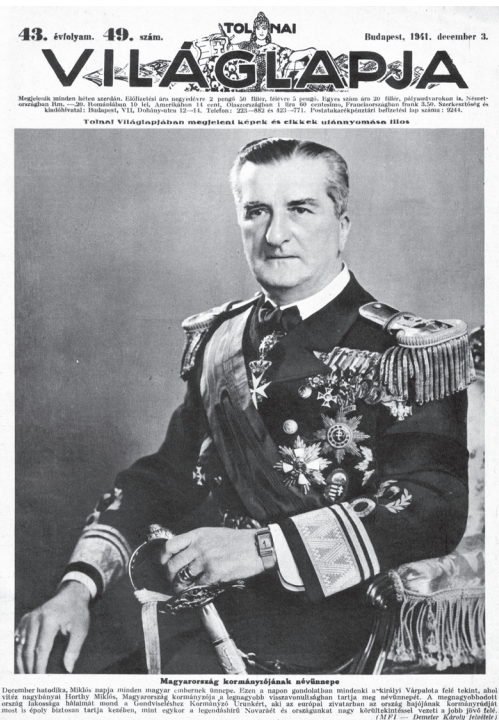
A Tolnai Világlapja 1941. december 3-i számának címlapja. A lap abban az évben így tisztelgett a „nemzet vezére” előtt Miklós-nap alkalmából

egy misztikus, halhatatlan teste. Az utóbbi köré szerveződött az egyház ( corpus Christi ). 30 Az egyház misztikus testének a feje természetesen Jézus Krisztus, a