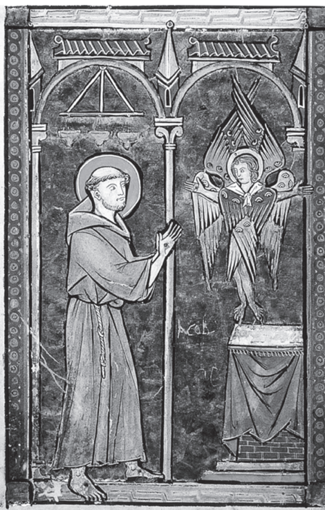
3. Szent Ferenc stigmái. Hóraskönyv. Carpentras, Bibliothèque Inguimbertaine, ms 77, f. 180v, XIII. sz. közepe.

nem aszketikus vagy eksztatikus öncsonkításból keletkeztek, hanem, mint Cortonai Illés írta: „soha-nem-hallott csodát” kell tisztelni bennük. Hogy pontosan hogyan keletkeztek, azt persze nem lehetett tudni, mert Ferenc sohasem beszélt róla, ez volt az ő „nagy titka”, és a stigmatizációnak nem voltak szemtanúi. 42 Ferenc első legendáirója, Celanói Tamás adott elő-