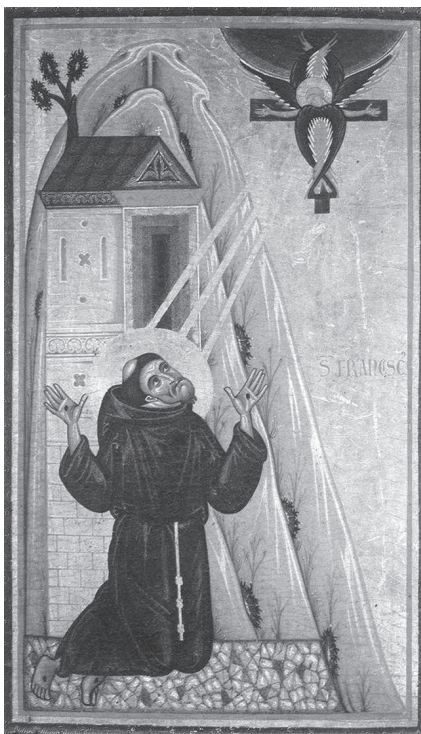
4. Szent Ferenc stigmái. Firenze, Uffizi, XIII. század közepe

A legkorábbi ábrázolás (1235) Bonaventura Berlinghieri pesciai oltárképének egy részlete. A „Krisztus az Olajfák hegyén” ikonográfiai konvencióját követve mutatja be a jelenetet – ez jól illik az alter Christus -elképzeléshez. Azt is megfigyelhetjük, hogy szinte áthatolhatatlan távolság választja el a térdelő Ferencet a felette lebegő szeráf-feszülettől (1. kép). Az angol Mathew Paris Chronica majora című műve 1236-ban egy másik konvencióhoz fordult: az álomlátomáshoz (2. kép) (ott szemlátomást csak hallomásból ismerték Celanói Tamás legendáját) 46 . A XIII. század közepi carpentrasi óraskönyv a vad természet és a hegy helyett egy kápolnába helyezi a színteret, ahol a szeráf egy oltáron áll (3. kép). A firenzei Bardi-kápolna mestere a ferences renden belüli radikális ellenzék, a Spirituálisok értelmezését közvetíti, ahol a szeráfot Ferenchez áramló három fény sugarú Ferenc megvilágosodását és a látomás fontosságát hangsúlyozza, mely azután belülről átalakítja Ferenc testét. (4. kép) 47