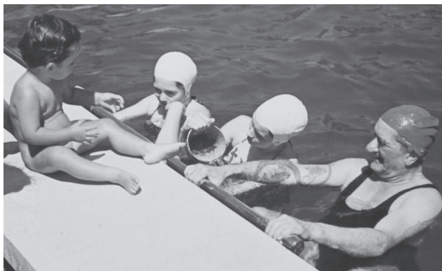
Horthy Miklós családjának néhány tagjával a kenderesi úszómedencéjükben. A képen jól látható az 1892–1894-es világtörli útja során szerzett – sárkányt ábrázoló – tetoválása

1940-ben „a magyar sport legfőbb patrónusaként” méltatták rövidebb cikkekben egyes napilapok sportrovatában. 44 Ez érthető, mert a propaganda a gazdaságpolitikától kezdve a külpolitikán át egészen az oktatáspolitikáig minden sikert, eredményt az államfő nevével hozott kapcsolatba. A sportban is, amely a magyar „újjászületés” szempontjából is kiemelt jelentőségre tett szert, miután ugyanis „a trianoni békeparancs még a fegyvert is eltiltotta a magyar öklöktől, a sportban jutott kifejezésre minden magyar férfias erény: bátorság, elszántság, szívósság, keménység, élni akarás”. 45