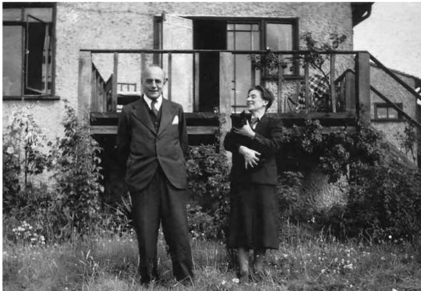
Polányi Károly és Duczyńska Ilona, London, 1938.

háború, a szocialista Bécs elpusztítása, a náci uralom idején közeli családtagjainak elvesztése és egymást követően négy száműzetés tapasztalatával a háta mögött – már nem volt olyan könnyen meggyőzhető. Roosevelt nagyra becsülte ugyan, de az 1945 utáni brit munkáspárti kormányt – a jóléti állammal megfejelt kapitalista rendszert – az elveket feladó megalkuvásnak tartotta.