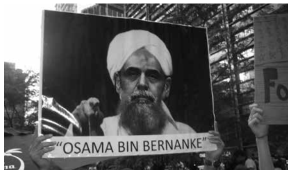
Occupy tüntetés 2011. szeptember

Hiába próbáltak új tulajdonost találni a fizetőkép-telenség határához érkezett befektetési bankba, a lehetséges vevők (köztük a Koreai Fejlesztési Bank) sorra visszaléptek. Szeptember 18-ára újabb jelentős veszteség bejelentésére készült a Lehman, s ez szűk időkeretbe szorította be a megmentésen buzgólkodó jegybankelnököt és Paulson pénzügyminisztert. „Ahogy közeledett a később a Lehmanról elnevezett hétvége, a közvélemény, a politikusok és a sajtó egyre jobban szembefordult azzal az elgondolással, hogy a Fed és a Pénzügyminisztérium rendkívüli intézkedésekkel akadályozza meg a Lehman csődjét” – panasolja könyvében Bernanke (249. old.). A Financial Times a két nagy, kormányzati háttérű, ám magánkézben lévő lakáshitel-ügynökség, a Fannie Mae és a