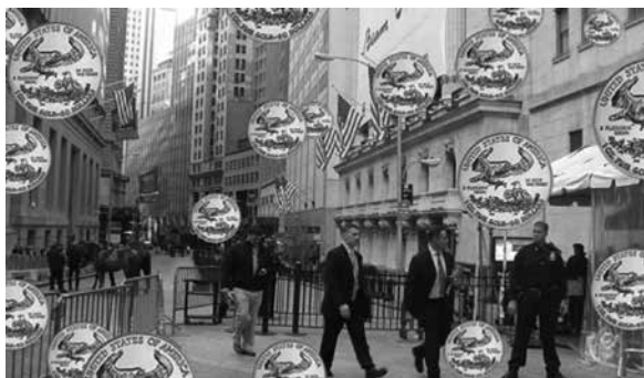
Occupy Wall Street, számítógépes kiterjesztett valóság kép

Elnökségének nyugalmi szakasza nem tartott sokáig: már 2007 augusztusában kipattant a „ subprime szikra”. De már jóval korábban is voltak a válságot előrevetítő jelek, csak akkor még jócskán alábecsülték