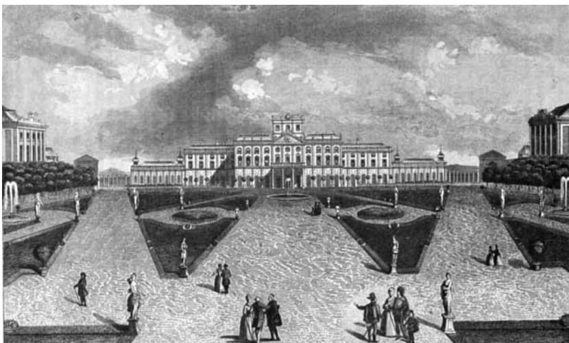
A kastély parkja, metszet Pesci 1784-es festménye után

rozatban; az opera-előadás ténye azonban példának okáért könnyen kikövetkeztető a jutalmazottak köréből. S hogy ezúttal miért honorálhatták Jacoby-t ilyen busásan? Erre is van kézenfekvő feltételezés: Pál Antal herceg 1762. március 18-án halt meg, Miklós ünnepélyes külsőségek közepette megtartott beiktatására pedig május 17-én került sor Kismartonban. A jutalom átvételéről Jacoby április 17-én írta alá az elismervényt (korántsem köszönetnyilvánítást,