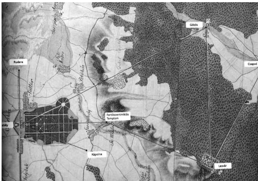
A három vue, avagy a lúdláb