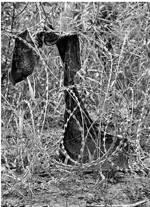
A hónap műtárgya: Muszlim női kendő Néprajzi Múzeum, 2015. november

lehet azoknak a csoportoknak, amelyek az adott projektben együtt dolgoznak a muzeológussal, a kurátorral. Természetesen az egyes területeken mást és mást jelent a részvétel, ennek tisztázásában segít az a modell, az ún. „demokratikus múzeum »participációs technológiáinak« elmélete”, amelyet észt muzeológusok 17 fejlesztettek ki saját intézményük megújítására (281. old.). Ez a részvételi akciókutatás keretei között létrehozott modell megkülönbözteti a kulturális intézmények (így a múzeum) különböző funkcióit és ezekhez igazodva adja meg a participáció